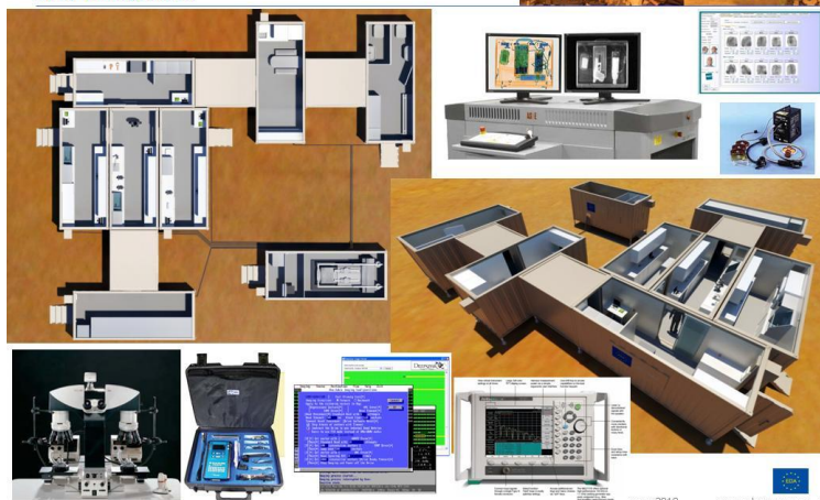
EDA – Counter-Improvised Explosive Devices Theatre Exploitation Laboratory Demonstrator TEL(D) – Likely Configuration

Les IED ont causé la mort de 352 soldats en 2010, constituant ainsi la première cause de mortalité au sein des troupes de la coalition déployées en Afghanistan.