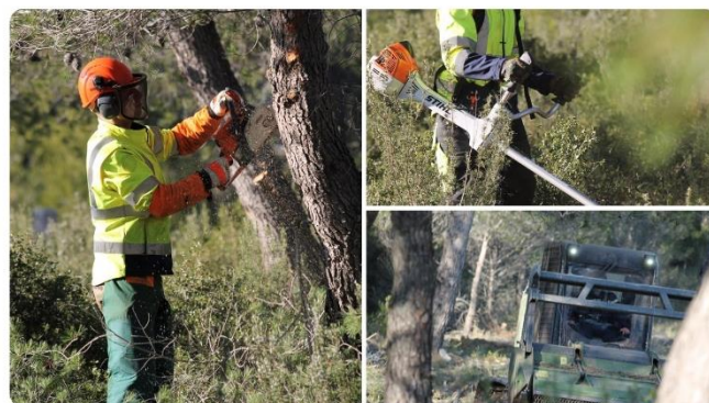
Armée de Terre et Légion étrangère