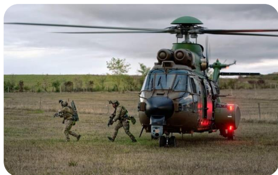
Dépose par hélicoptère de forces spéciales

Se déroulant en Occitanie, l'exercice Manticore a pour objectif d'entraîner des unités d'engagement d'urgence et d'aérocombat à la projection de forces dans la profondeur dans un contexte de haute intensité. Exigeant la maîtrise de savoir-faire très particuliers, cet exercice entre dans le cadre de la préparation opérationnelle des spécialités aéroportées et d'aérocombat, ainsi que des forces spéciales. Les trois grandes unités représentées se sont entraînées ensemble dans une combinaison d'exercices en terrain libre à haute valeur ajoutée en termes de préparation opérationnelle.