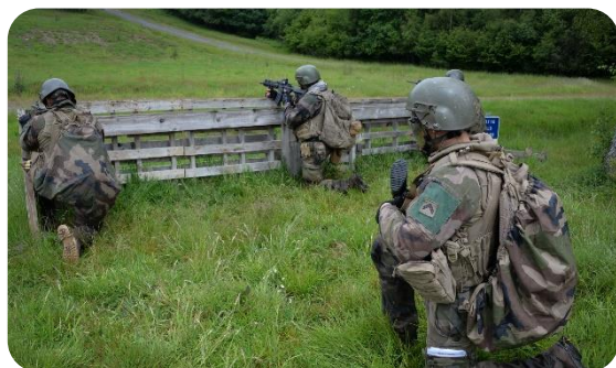
Camp de la Courtine – Trinôme d'infanterie