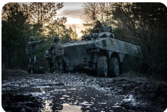
Mailly-le-Camp – Véhicule blindé de Combat d'Infanterie

Pour conduire au quotidien leur #PrepaOps, nos légionnaires peuvent compter sur le peloton camp. Il entretient nos zones de manœuvre et prévient tout risque d'incendie 🧑‍🌾 #EcoOps 🌱