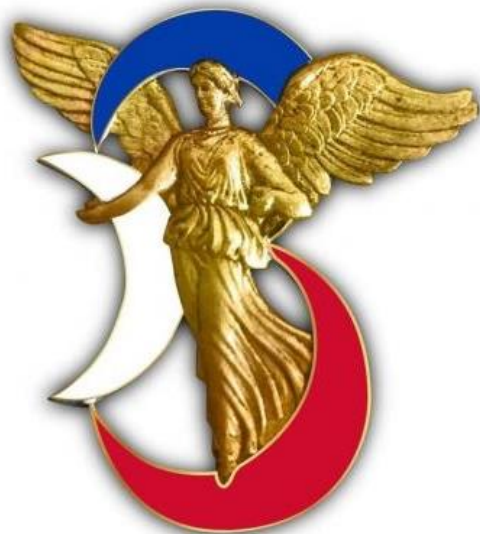
Victoire de Constantine, insigne de la 3 e division

La division a rempli sa mission, en étant interopérable dans tous les domaines techniques et doctrinaux et capable de combattre au sein d'un corps d'armée américain, dans un contexte d'engagement de haute intensité. Ces succès tactiques et d'interopérabilité avec les alliés démontrent un niveau de maîtrise des fondamentaux sur laquelle la division capitalise encore aujourd'hui.