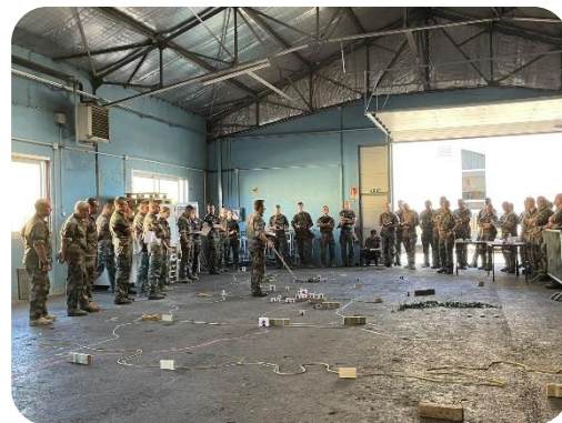
Etat-major régimentaire d'un régiment parachutiste préparant sa mission