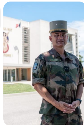
Général Rémy Cadapeud, commandant la 3 e division

Etre prêt. Non pas seulement à être engagés, mais être prêts à vaincre dès le premier choc. Fournir aux forces terrestres un système de combat divisionnaire, intégré à un corps français ou allié et intégrant une brigade alliée et sans doute des appuis alliés, capable d'opérer en surclassant l'ennemi dans la profondeur, au contact (combat des brigades) et dans la zone arrière (sauvegarde et flux logistiques). Pour cela nous nous entraînons, postes de commandement et unités déployées (27 régiments au total) dans des exercices en France et à l'étranger, le plus souvent possible intégrés dans le Corps de Réaction rapide – France (CRR-FR). Cette préparation opérationnelle exigeante permet de conserver la maîtrise indispensable des savoir-faire liés directement aux engagements de haute intensité. Elle est renforcée par la solidarité et l'expérience des hommes de la division, habitués à gérer des situations de combat en opérations extérieures, et dotés d'une force morale très élevée.