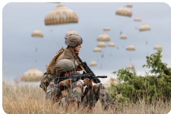
Largage de 300 parachutistes pour la saisie d'un point clé