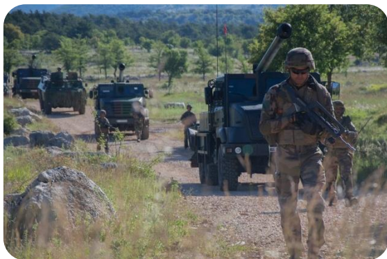
Canjuers – Batterie d'artillerie en mouvement

L'armée de Terre met en œuvre une politique de développement durable sur l'importante superficie représentée par les camps et centres : espaces Natura 2000, champs de panneaux solaires, pâturages, puits de verdure.