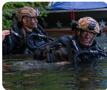
Infiltration de plongeurs de combat du génie

4 400 soldats 6 opérations aéroportées en trois semaines 50 hélicoptères