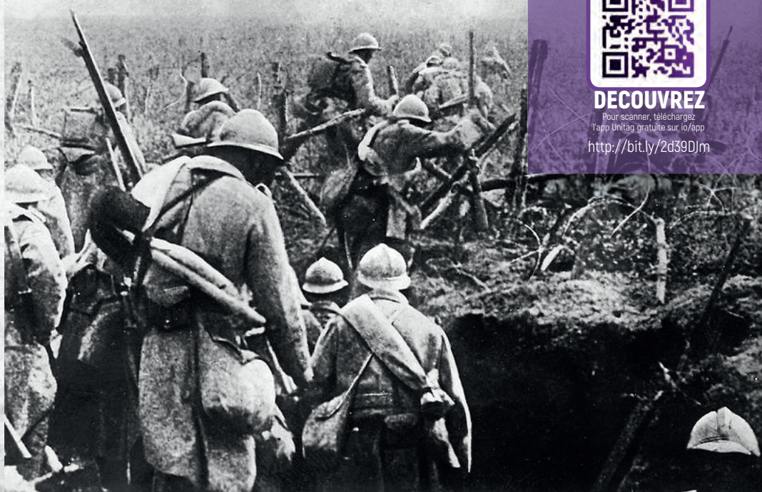
Soldats français à l'assaut pendant la campagne de Verdun.

relèves sont effectuées ; commencent alors les heures interminables précédant l'assaut prévu à 11 h 40. Le 4 e bataillon du chef de bataillon Modat s'élançait. Il doit parcourir près de 1000 mètres pour atteindre son objectif ; au rythme théorique de 100 m toutes les 4 minutes pour suivre le canon. Impossible à tenir, un brouillard dense recouvre un terrain bouleversé et inondé d'une boue gluante. Malgré le mitraillage, des poches de résistance meurtrières se dévoilent. Le combat est acharné et sanglant. Les pertes s'accumulent. Le GBA Modat est blessé ; le CNE Alexandre le remplace. Vers 13 h, l'objectif est atteint et l'organisation du terrain commence.