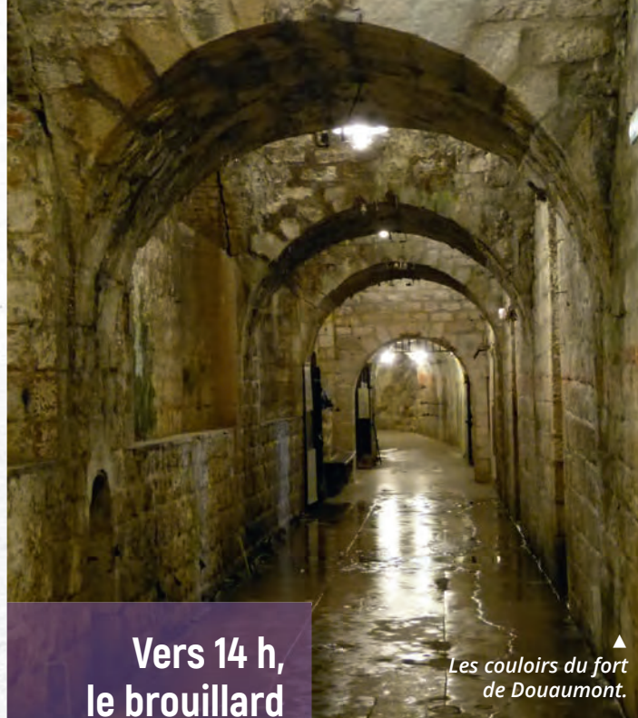
Les couloirs du fort de Douaumont.

La préparation d'artillerie débute le 20 octobre et déverse des milliers d'obus de tous calibres sur les positions ennemies. À partir du 21, les unités montent en ligne ; dans la nuit du 23 au 24, les dernières