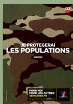
Recrutement de l'armée de Terre