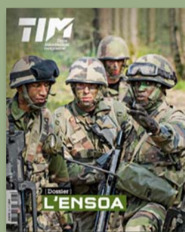
Terre Info Magazine