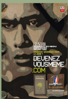
Recrutement de l'armée de Terre