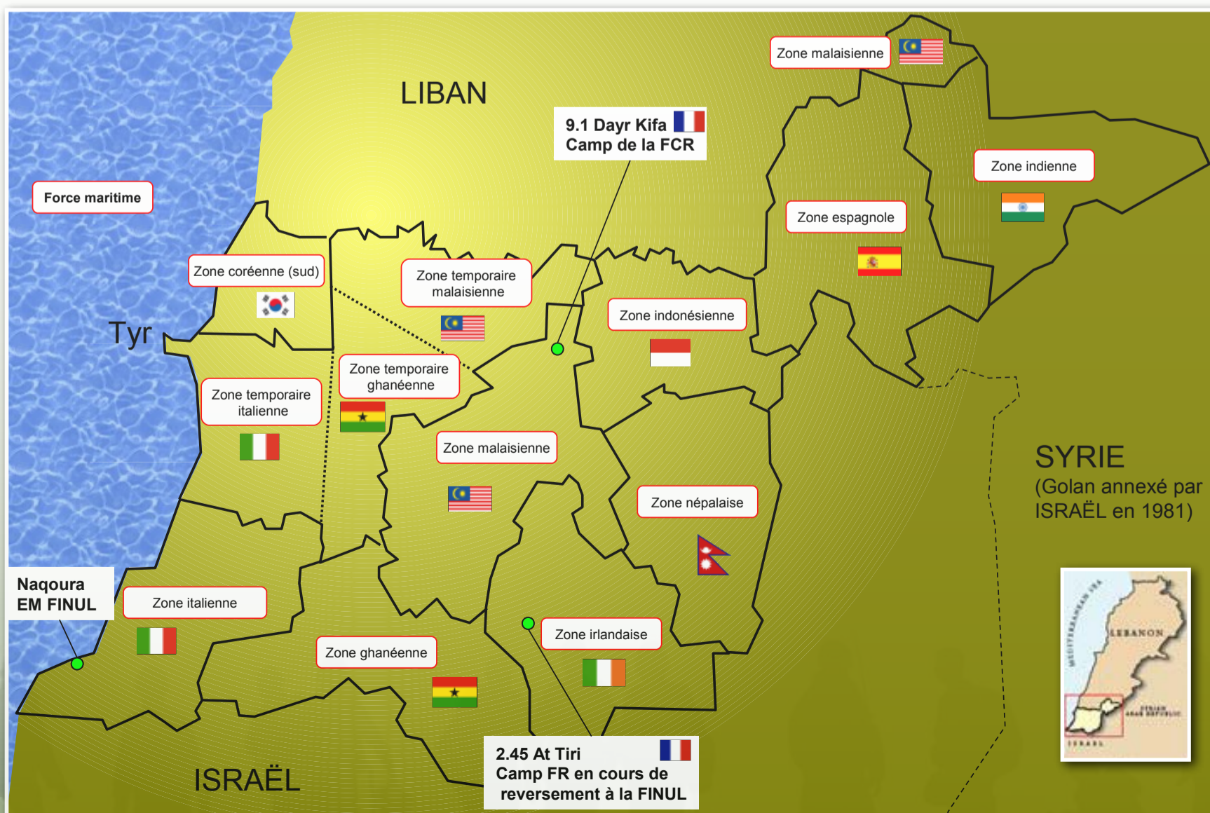
Répartition géographique de la zone FINUL 2