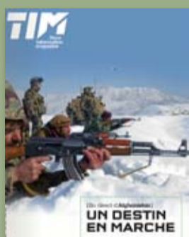
Terre Info Magazine