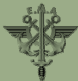
Etat-major des armées

Inflexions civils et militaires : pouvoir dire