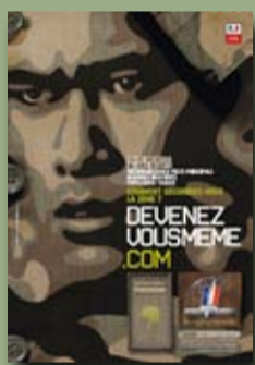
Recrutement de l'armée de Terre