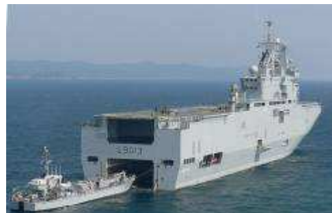
Le Dixmude est le dernier né des BPC. Il assurera la mission Jeanne d'Arc comme son aîné le Mistral (en photo) en 2011. L'année dernière, la 9 armait déjà le GTE de la mission Jeanne d'Arc, c'était le GA Mer Rouge.

création du brevet SQOA et que le 2.000 e brevet rond au Poseïdon conquérant sera remis à l'un des marsouin, bigor ou sapeur de Marine engagé avec le GTE.