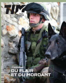
Terre Info Magazine