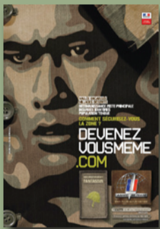
Recrutement de l'armée de Terre